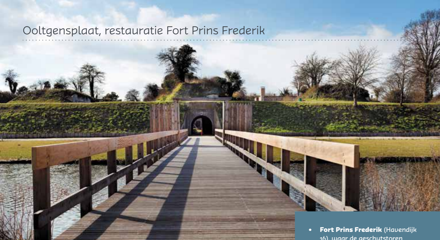
Fort Prins Frederik met gereconstrueerde toegangsbrug.