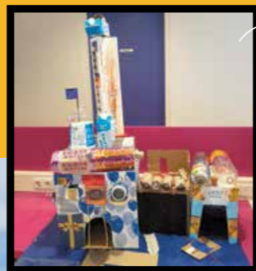
Kinderen van basisschool De Regenboog in Ooltgensplaat hebben het lesproject van het Fort gedaan, ze gingen bijvoorbeeld het fort namaken. Dat is goed gelukt bij het fort hiernaast!

Het is al iets meer dan 200 jaar oud en toen waren de Fransen de baas hier. Napoleon zou om het land te verdedigen daar een fort bouwen en noemde het fort Duquesne. Toen de dorpingen van Ooltgensplaat de Fransen uit het fort verjaagden, hebben ze het fort een andere naam gegeven namelijk Fort Prins Frederik. Later is het nog gebruikt door de Duitsers. En daarna werd het fort niet meer gebruikt voor verdediging.