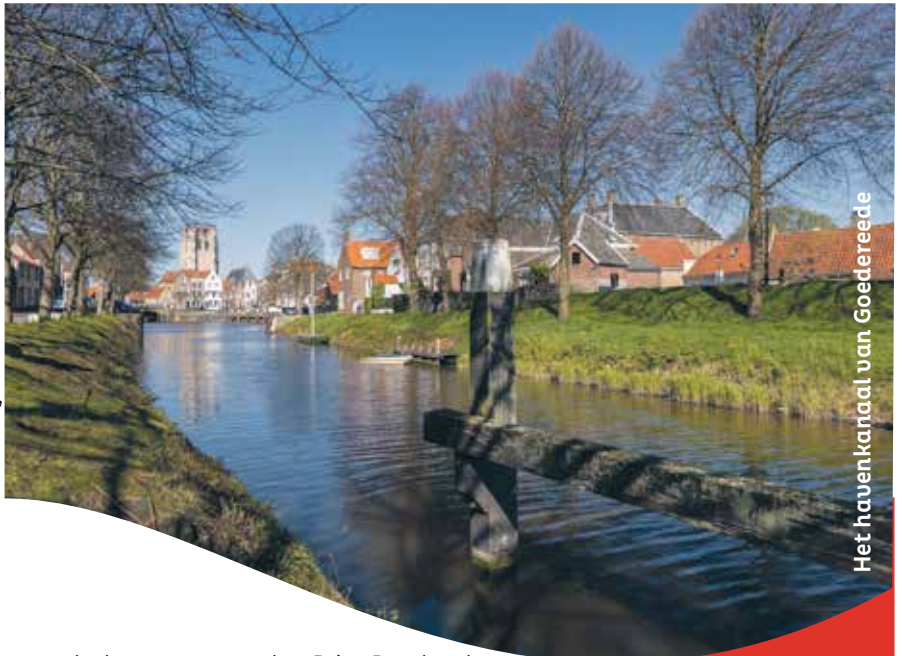
Het havenkanaal van Goedereede

De Erfgoedlijn Goeree-Overflakkee is een initiatief van de provincie Zuid-Holland. De provincie maakt het mogelijk om het erfgoed in Zuid-Holland te bezoeken, ervan te genieten en te leren over onze geschiedenis. Zo blijft ons erfgoed voor de toekomst behouden. Dat doet de provincie niet alleen, maar in nauwe samenwerking met andere partijen, vooral van het eiland zelf. Dat gebeurt in samenwerking met tal van andere partijen, vooral op het eiland zelf. Zoals de dorpsraden, ondernemers, VVV, het Streekmuseum, het RTM-museum, KunstPlus, Stichting Podium Goeree-Overflakkee, de gemeente en Erfgoedhuis Zuid-Holland. De provincie Zuid-Holland ondersteunt de erfgoedprojecten onder meer met subsidie. Ook andere partijen,