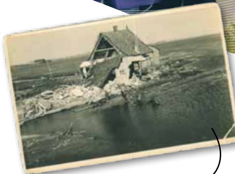
De dijkdoorbraak bij Battenoord sterk dat ze niet