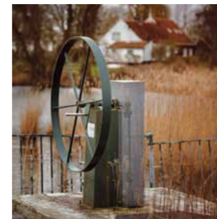
Bij de Weel staat een handwiel van het waterschap.