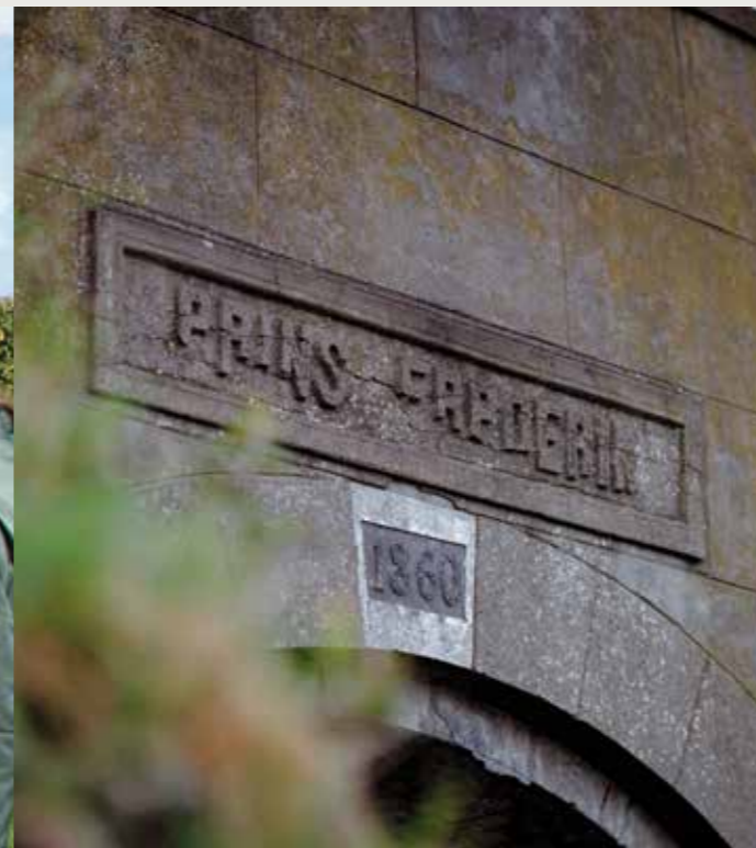
Duitse soldaten probeerden de letters van het fort te schieten...

Claire en Eleena missen niks in het dorp en vinden dat Ooltgensplaat eigenlijk